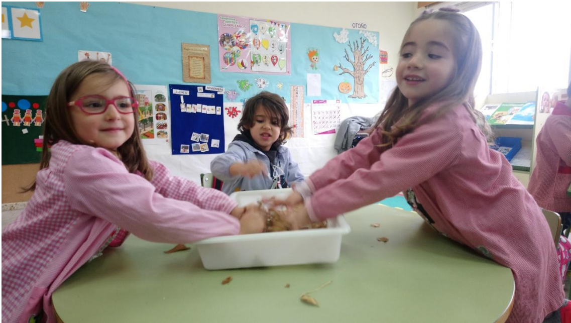
NOS ENCANTA LA TEXTURA DE LAS HOJAS!