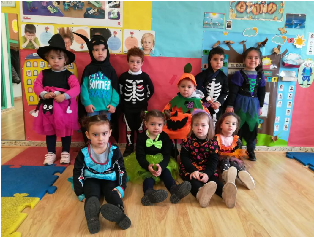
¡ qué susto! Otra clase de niños de 3 años